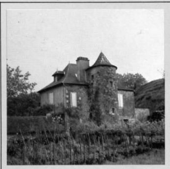
Ozazeko Jauregia jauregia.