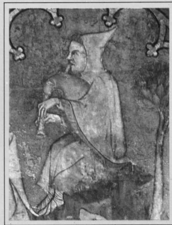
Erriberri (Ollite)-ko xirolarru joilea. XIV gn mendea.

Oi Zuberoa bizitzaren ametsa, negarra dagit sakonki, hiri so nere hatsa duk bihurtzen auhena, oi Zuberoa zer hintzen eta non hago.