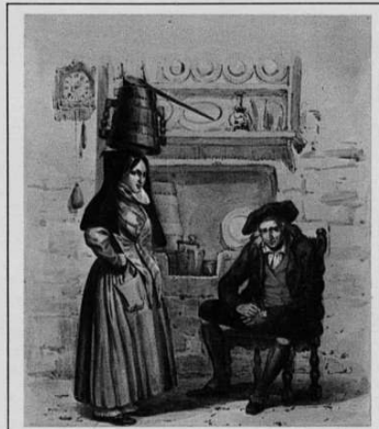
Zuberoko grabado zaharra.

Desertiala juan nahi bazira, arren zuaza, oi, bena berhala. Etzitiala jin harzara nigana, bestela gogua dolütüren zaizü, amoros gaxua.