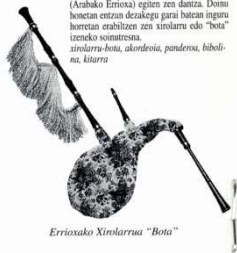
Errioxako Xirelarrua "Bota"

Musika: herri musika. A. Donostiaren kantategitik hartua. San Bizente eguztan Oñen (Arabako Errioxa) egiten zen dantza. Dantza honetan entzan diralotzega gara botan inguru horretan erabiltzen zea xirelarru edo "bota" izeneko soinutresna. xirelarru-bota, akordeoia, panderoa, bibelina, kitarra