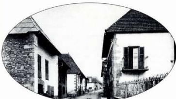
Auritzeko Karrika. (Dantzariak 36)

Xirelarru-bota, txistu, akordeoia, dambolina, panderoa, atabola, bibelina, kitarra